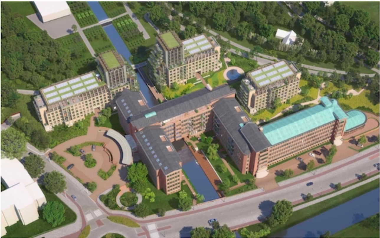
Impressie van parkeergelegenheid (ontleend aan plesmanduin.nl )