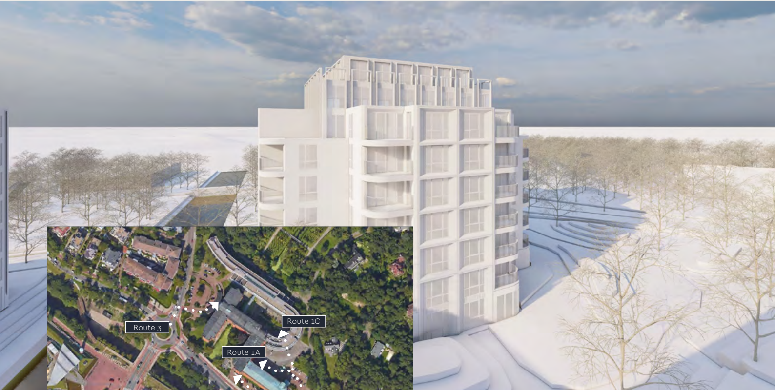
Beeld vanuit het penthouse van het monument.