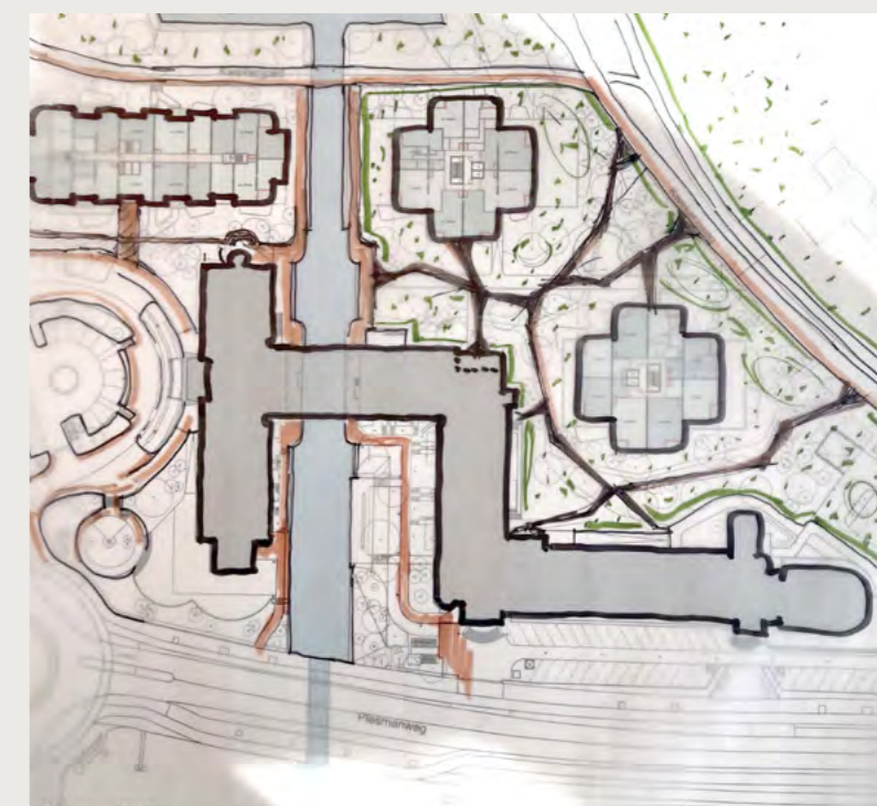
Schets van het landschap. Informele wandelpaden structuur.

In geval van calamiteiten of onraad kunt u contact opnemen met Van Wijnen West, telefoon: 0182 34 80 88. Overige vragen kunt u mailen naar info@plesmanduin.nl